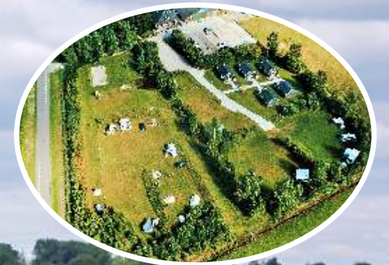
Rust Ruimte Natuur